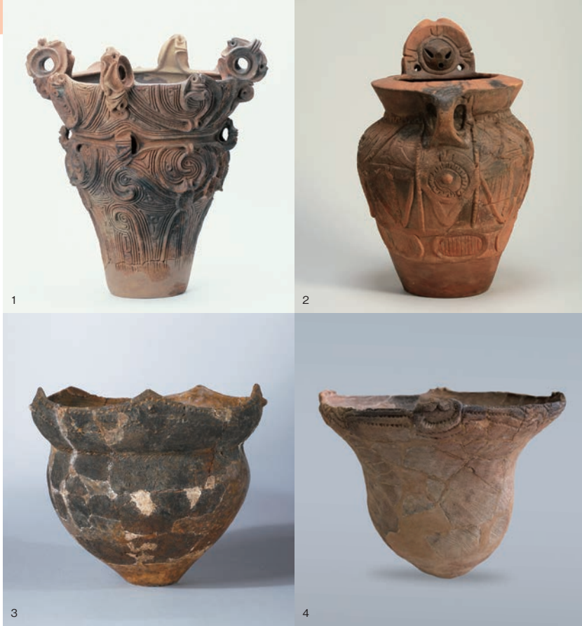
1 深鉢 (重要文化財) 道訓前遺跡出土 浜川市教育委員会蔵 2 顔面把手付大深鉢 (長野県宝) 月見松遺跡出土 伊那市創造館蔵 3 深鉢 粟津湖底遺跡出土 滋賀県埋蔵文化財センター蔵 4 深鉢 上水流遺跡出土 鹿児島県立埋蔵文化財センター蔵

そんな縄文人「ジョウモンさん」と、約5千年前の縄文時代と一緒に旅してみませんか？