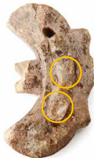
子持勾玉 6世紀(古墳時代) 上ノ段遺跡(加納町)

勾玉は日本の古代における装身具のひとつです。子持勾玉は、大きな勾玉の腹や背などに、小さな勾玉（子勾玉）を数個つけた勾玉のことで、神や祖先をまつる儀式で用いたとみられるよ。この勾玉には7つの子勾玉がついています。○で囲んだ2つ、裏側に2つ。のこり3つはどこにあるかな？