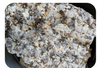
小原地区の花こう岩

フモトミズナラは、モンゴリナラともよばれるどんぐりです。小原地区や藤岡地区など、花こう岩地帯の栄養が少ない場所に生えるめずらしい植物です。