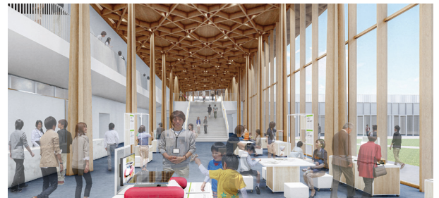
えんにち空間 くわかん

した え み ぶ ぶん さが 下の絵を見て、デザインのもとになっている部分を探してみよう!