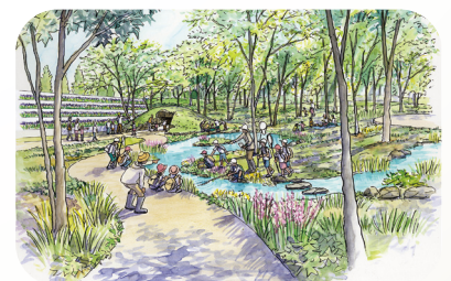
もり かん さつつけ どんぐりの森と観察池