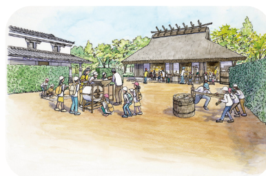
どぞう いえ 土蔵とむかしの家