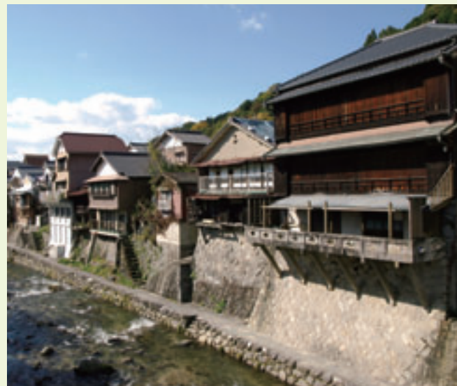
●真弓橋から見る川沿いの風景

足助川沿いでは、幕末から近代にかけて川岸に石垣を築き、川に張り出すように座敷などが建てられました。石組み階段とともに、川との繋がりを映した景観をつくり出しています。