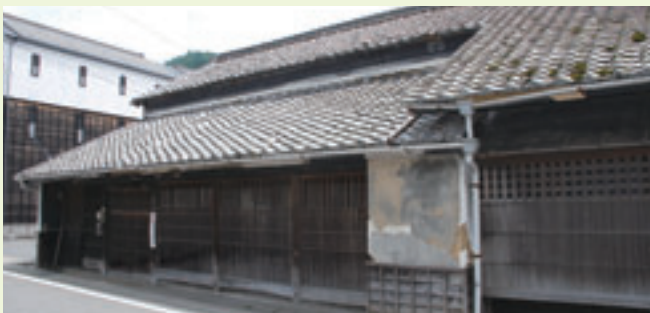
●旧紙屋鈴木家住宅

上屋根と下屋根にわずかに段差をつけた鍛葺き形式の軒高の低い主屋が残されています。これらは安永4年(1775)の大火前の建物形式を伝える可能性が高いと考えられます。