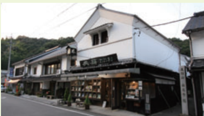
●深見家住宅とマンリン書店

足助の町家は、2階のちがいが高い平入2階建て形式が主流で、白漆喰で仕上げられた外壁とあいまって、重厚な景観をつくり出しています。豪壮な小屋組みは地域の豊富な木材と工匠の技術に基づくものです。