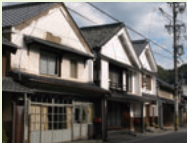
●連続する妻入家屋

明治44年（1911）に国鉄中央線が開通すると、物資の輸送基地としての機能は次第に衰退しますが、その後も足助は東加茂郡の中心として歩み続けました。